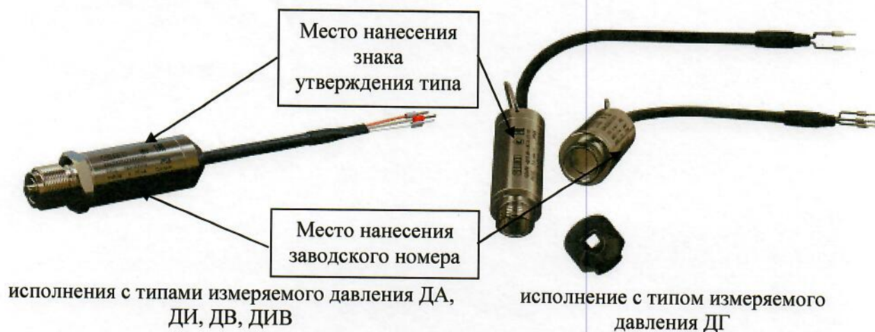
Рисунок 4 – Общий вид преобразователей давления измерительных ОВЕН ПД100И со встроенным кабелем с указанием места нанесения знака утверждения типа, места нанесения заводского номера