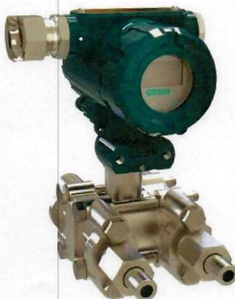
исполнение с типом измеряемого давления ДД