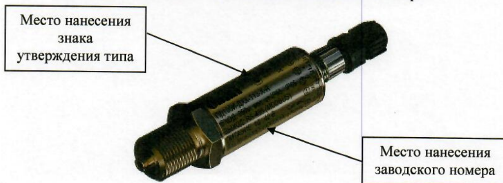
Рисунок 3 – Общий вид преобразователей давления измерительных ОВЕН ПД100И с разъёмом М12 с типами измеряемого давления ДА, ДИ, ДВ, ДИВ с указанием места нанесения знака утверждения типа, места нанесения заводского номера