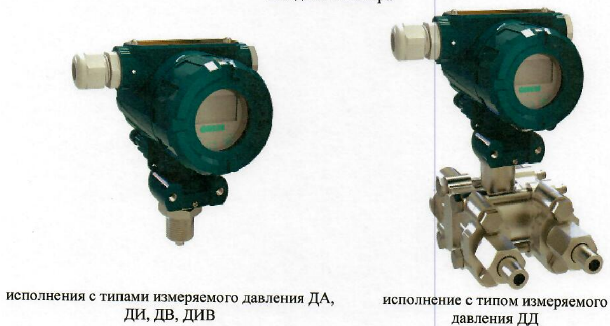
Рисунок 5 – Общий вид преобразователей давления измерительных ОВЕН ПД100И со встроенным дисплеем в общепромышленном исполнении