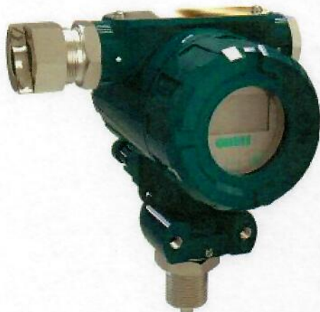
исполнения с типами измеряемого давления ДА, ДИ, ДВ, ДИВ